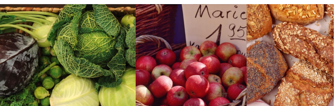
Bio-Vielfalt aus der Region

In Zusammenarbeit mit: Diakonie Bremen Brot für die Welt Contrescarpe 101 (Seiteneingang Birkenstr. 34) 28195 Bremen Tel. 0421/163840 info@diakonie-bremen.de