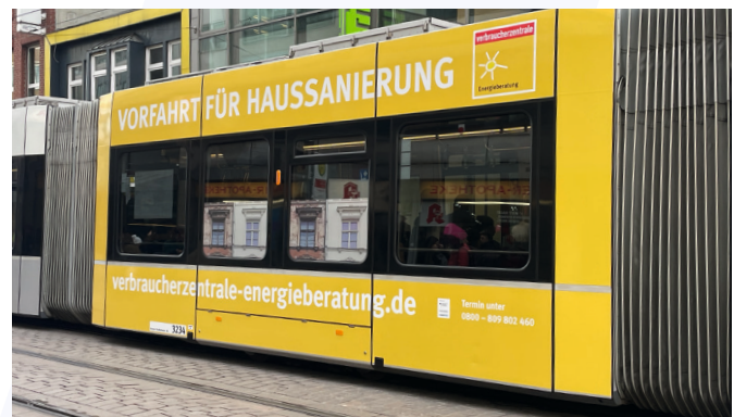
Vorfahrt für die Energieberatung der Verbraucherzentrale auf der Bremer Straßenbahn.

Zur Entlastung und als Reaktion auf die Energiepreiskrise wurden Strom- und Gaspreisbremsen eingeführt. Kehrseite der Preisbremsen war, dass jeder Strom- und Gasanbieter eine andere rechnerische Darstellung wählte. Somit waren diese kaum vergleichbar. Rückfragen bei den Energieversorgern standen auf der Tagesordnung. Verbraucher:innen überraschte positiv, dass die hohen Energiepreise nicht zu hohen Nachzahlungen führten. Dies lag an der Deckelung der Energiepreise und am sparsameren Verhalten gepaart mit höheren Vorauszahlungen. Es könnte vielfach in Vergessenheit geraten, dass Energierechnungen durch den Wegfall der Preisbremsen und das Anheben der Mehrwertsteuer bei Gas von 7% auf 19% wieder deutlich höher ausfallen werden.