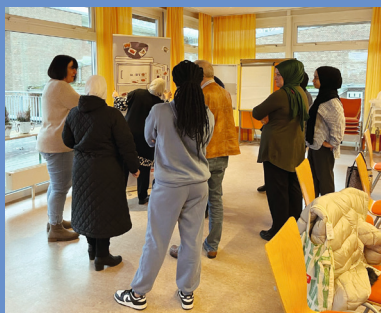
Teilnehmende am Workshop zur richtigen Lagerung von Lebensmitteln

Zum Ende des Jahres haben wir mit der Bewilligung eines weiteren Verbundprojektes noch einen Erfolg feiern können. Bei „Gemeinsam Ernährungswende gestalten“ arbeiten die Senatorin für Umwelt, Klima und Wissenschaft, die Bremer Volkshochschule, das Leibniz-Institut für Präventionsforschung und Epidemiologie und der MOIN! Ernährungsrat für Bremerhaven, das Cuxland und Umzu e.V. zusammen mit der Verbraucherzentrale Bremen an der Reduktion von Lebensmittelabfällen in Schulen. Das Projekt wird durch das Bundesministerium für Ernährung und Landwirtschaft gefördert. Wir sind auf die Ergebnisse gespannt und berichten im kommenden Jahresbericht.